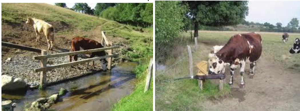
Exemple d'aménagement de systèmes d'abreuvement au champ

Pour CSM, le montant prévisionnel des dépenses est de 420 590 € sur 3 ans, avec 232 723 € de subventions (soit un reste à charge de 187 867 € sur 3 ans). Ces dépenses sont finançables par la taxe GEMAPI.