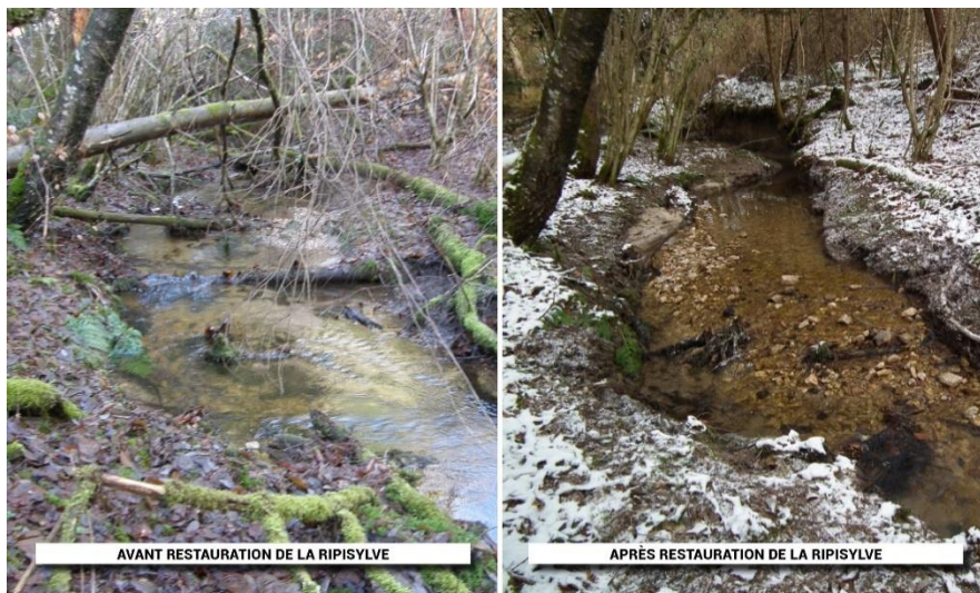
Exemple restauration d'une ripisylve :