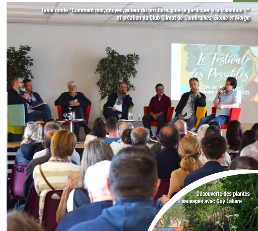
Table ronde "Comment moi, citoyen, acteur du territoire, puis-je participer à la transition ?" et création du Club Climat de Combrailles, Sioule et Morge

La journée de clôture, le 7 mai 2022 à Charbonnières-les-Vieilles, a regroupé une cinquantaine de producteurs, artisans locaux, associations et organismes intervenant dans la transition. Les nombreux visiteurs ont pu, entre deux expositions, participer à de multiples ateliers pour toute la famille, des conférences, des balades commentées, le tout dans une ambiance festive et musicale. Cette journée a vu la création officielle du Club Climat dont l'objet est de suivre l'évolution du PCAET, de favoriser l'émergence d'initiatives et de solutions locales en matière de préservation du climat et de l'environnement, mais aussi de développer les synergies entre les différents acteurs du territoire.