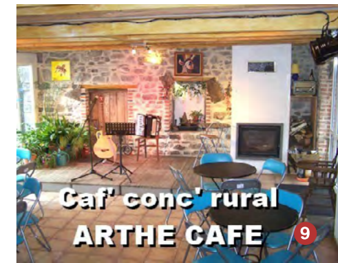
Caf' conc' rural ARTHE CAFE