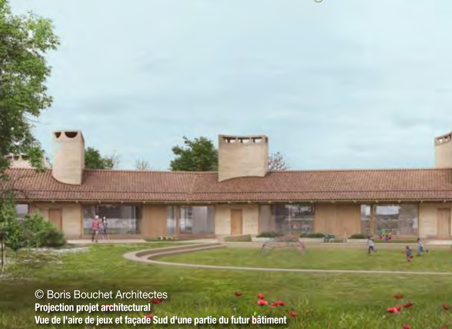
© Boris Bouchet Architectes Projection projet architectural Vue de l'aire de jeux et façade Sud d'une partie du futur bâtiment

La communauté de communes souhaite organiser, à l'échelle du territoire, ses offres d'animation extrascolaires autour de 3 pôles. Celui prévu à Beuregard-Vendon est programmé sur le site de l'ancienne mairie. Présentant une situation optimale en centre-bourg, à proximité de l'école, les travaux prévus visent à la rénovation et à l'extension du bâtiment. Ce Pôle Enfance-Jeunesse présente une architecture "Low tech" avec un niveau de performance énergétique élevé (équivalent à « Effinergie Rénovation ») tout en privilégiant l'utilisation de matériaux biosourcés (briques de terre crue, bois local, ...). Ce projet permettra d'accueillir 216 enfants et 30 ados dans des espaces dédiés de qualité. Le concours de maîtrise d'œuvre a permis de retenir l'entreprise Boris Bouchet Architectes, qui réalisera le projet. Dès septembre, l'élaboration de l'avant-projet définitif sera engagé, dans l'objectif de déposer le permis de construire début 2023.