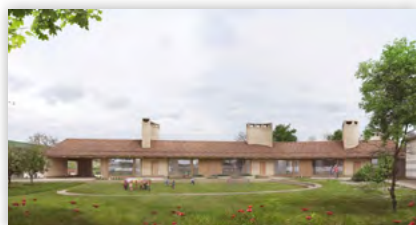
En bref Les dernières actualités