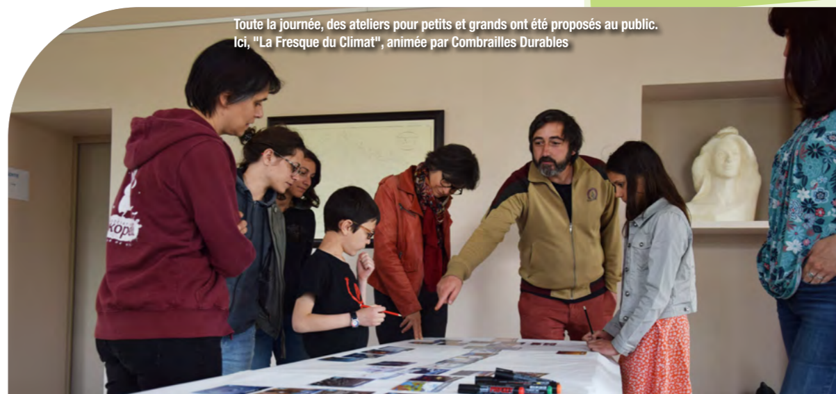
Toute la journée, des ateliers pour petits et grands ont été proposés au public. Ici, "La Fresque du Climat", animée par Combrailles Durables

Une première rencontre aura lieu courant octobre 2022.