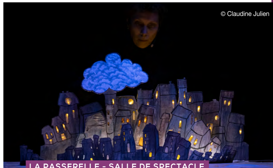
LA PASSERELLE - SALLE DE SPECTACLE