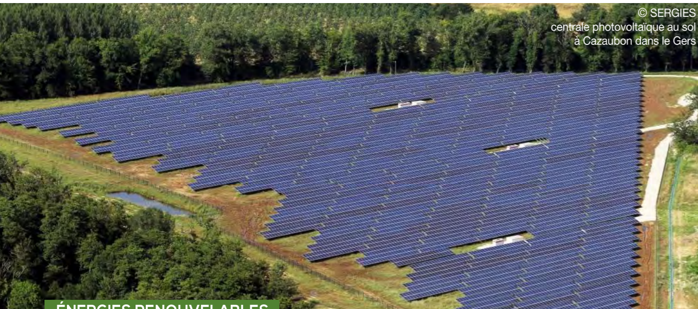
centrale photovoltaïque au sol à Cazaubon dans le Gers