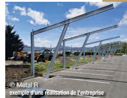
© Metal R exemple d'une réalisation de l'entreprise

Pour sa part, la société S.P.L. 63, ayant une activité de garage poids lourds et travaux publics sur la commune de Beuregard-Vendon, devrait prochainement transférer son activité sur la zone d'activités du Parc de l'Aize à Combronde, à proximité du restaurant "La Table de l'Aize". Cette nouvelle localisation permettra à l'entreprise de bénéficier d'un emplacement idéal, aux portes des autoroutes A71 et A89. L'entreprise espère développer son activité de garage poids lourds grâce à sa proximité avec les entreprises logistiques du parc.