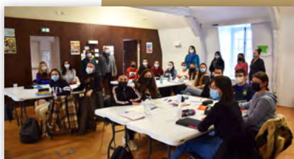
Jeunesse Le BAFA Citoyen