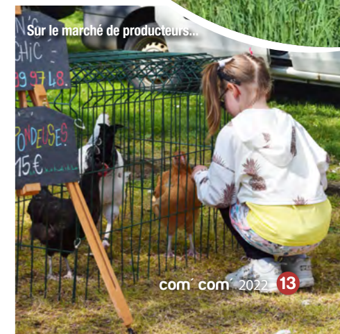
Sur le marché de producteurs...