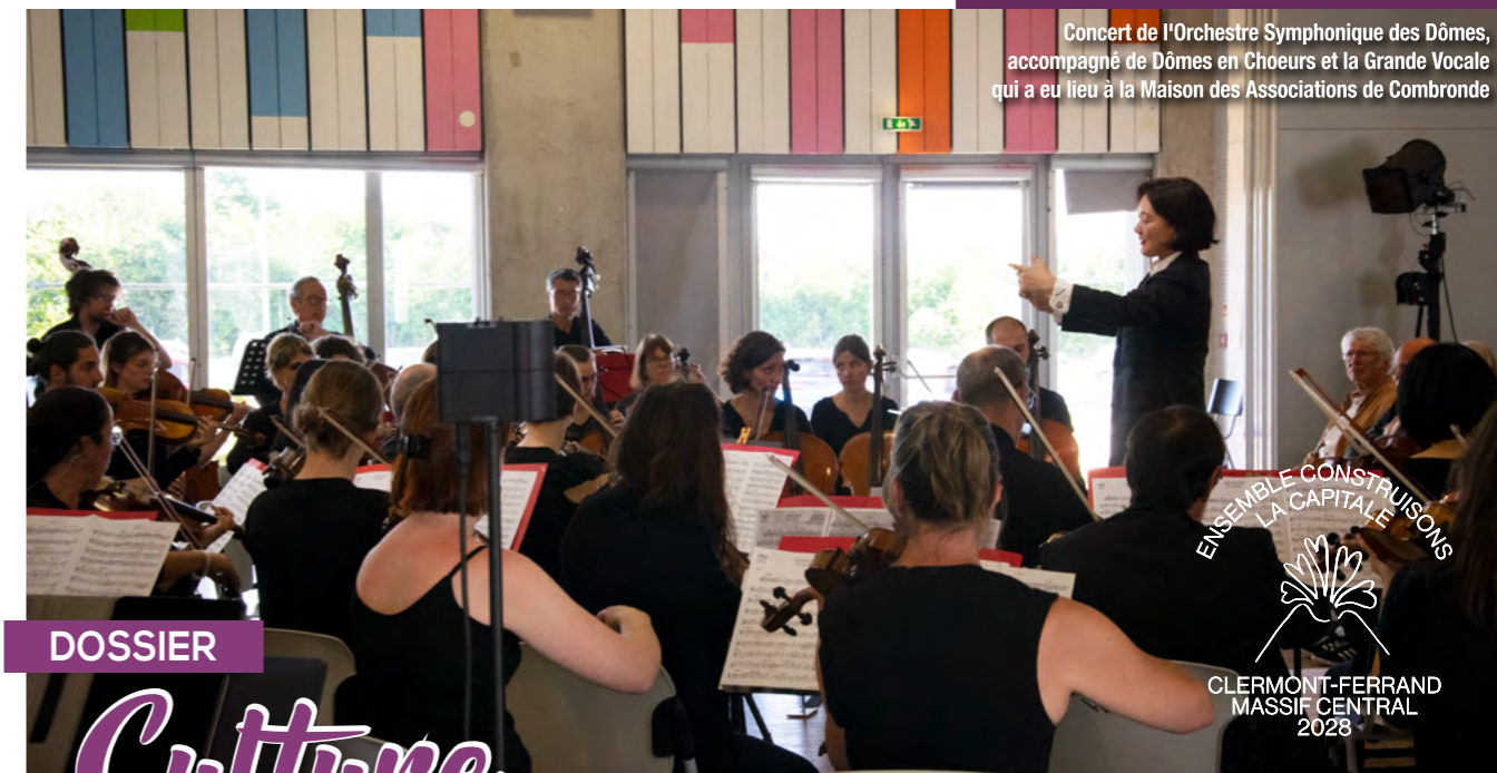
Concert de l'Orchestre Symphonique des Dômes, accompagné de Dômes en Choeurs et la Grande Vocale qui a eu lieu à la Maison des Associations de Combronde

ENSEMBLE CONSTRUISONS LA CAPITALE CLERMONT-FERRAND MASSIF CENTRAL 2028