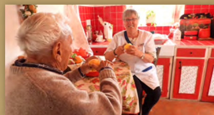
Action Sociale La Semaine Bleue